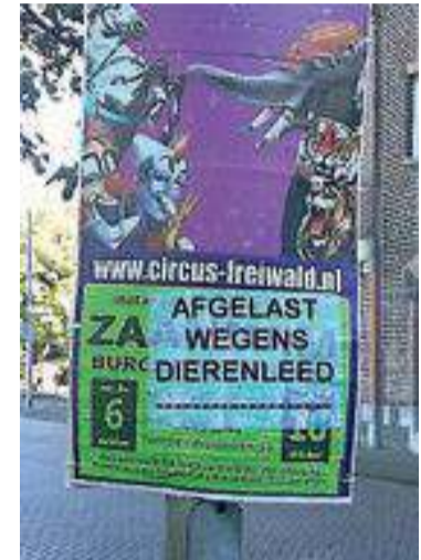
Zaans protestaffiche.