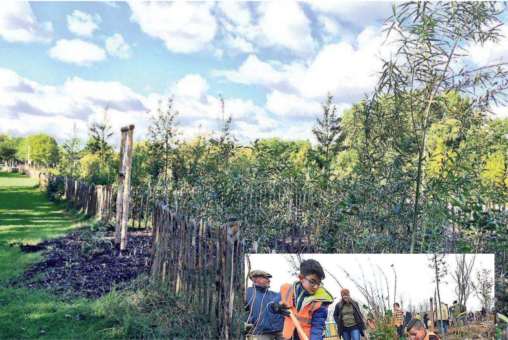
Rechts het 'tiny forest' en links-achter het controlebos. Inzet: leerlingen helpen mee met het planten van beide bossen in december 2015.