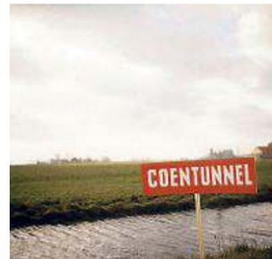
Zaanse inzending. FOTO ARCHIEF

Zaanstad * De gemeente Zaanstad stuurt een foto met een bordje 'Coentunnel' in voor de verkiezing van Archiefstuk van het jaar. Volgens Zaanstad sluit de foto perfect aan bij het thema van dit jaar: grenzen. Lange tijd was het Noordzeekanaal niet alleen de grens tussen Zaandam en Amsterdam, maar ook een barrière voor het wegverkeer. De tunnel onder het kanaal door werd in 1966 geopend, nu vijftig jaar geleden. De aanleg van de tunnel ging niet zonder slag of stoot. Symbolisch is een bordje 'Coentunnel', dat in de jaren '50 in de Achtersluispolder werd geplaatst. De wedstrijd om de titel Archiefstuk van het jaar is een publiekswedstrijd, stemmen kan via de webstie www.stukvanhetjaar.nl . Het Gemeentearchief Zaanstad hoopt tege-lijktijd meer te weten te komen over de foto. Zo is de naam van de fotograaf tot op heden onbekend.